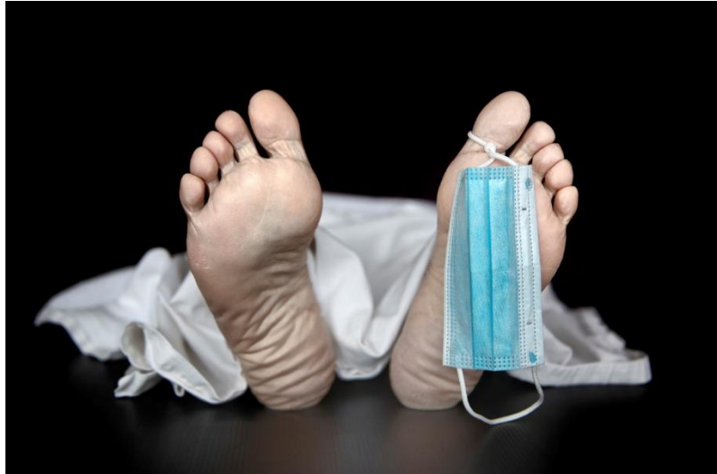
Izbor fotografij z razstave na Filozofski fakulteti Univerze v Ljubljani od 14. 9. do 14. 10. 2021