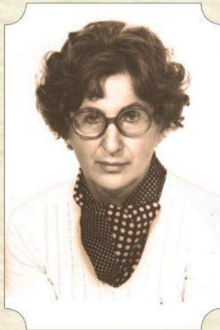
Milica Bergant (1950–1993)